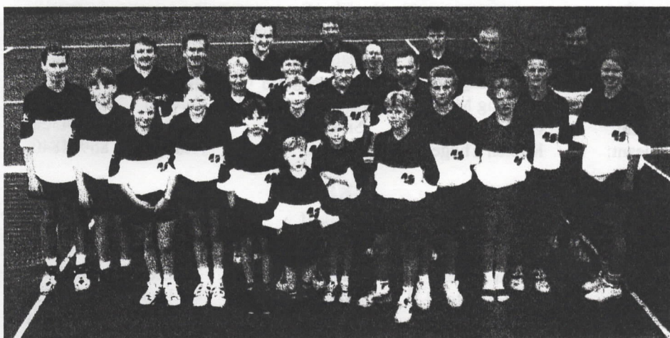
Dette er ca. halvdelen af Hadsten Tennisklubs turneringsspillere i 1997

For første gang nogen sinde er alle klubbens turneringshold ens påklædt under turneringskampene.