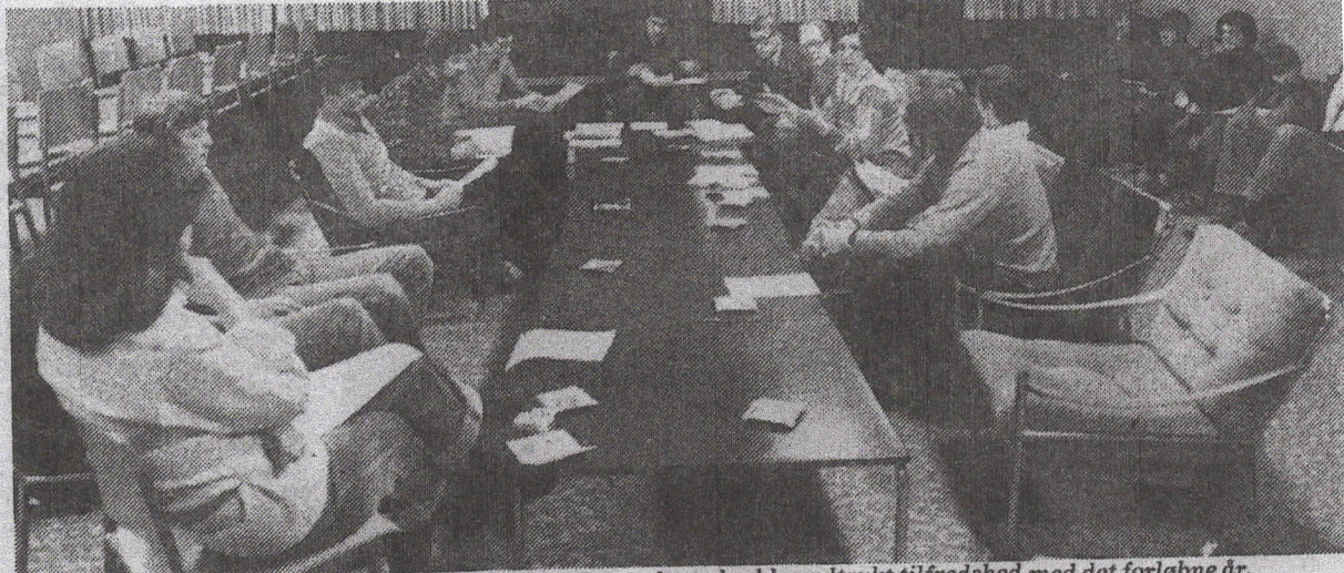
Cirka en snes tennisspillere deltog i generalforsamlingen, hvor der blev udtrykt tilfredshed med det forløbne år.