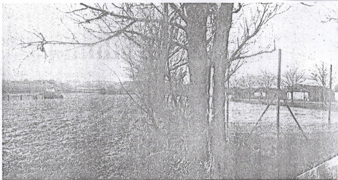
Det er arealet til venstre i billedet, kommunen nu har købt. Til højre det nuværende tennisanlæg.